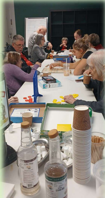
Jeux de société et cafés aromatisés