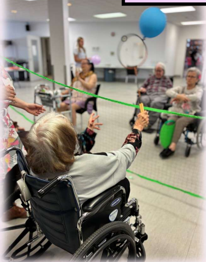
On bouge avec le ballouneminton!