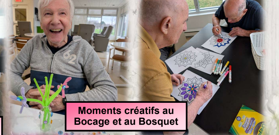
Moments créatifs au Bocage et au Bosquet