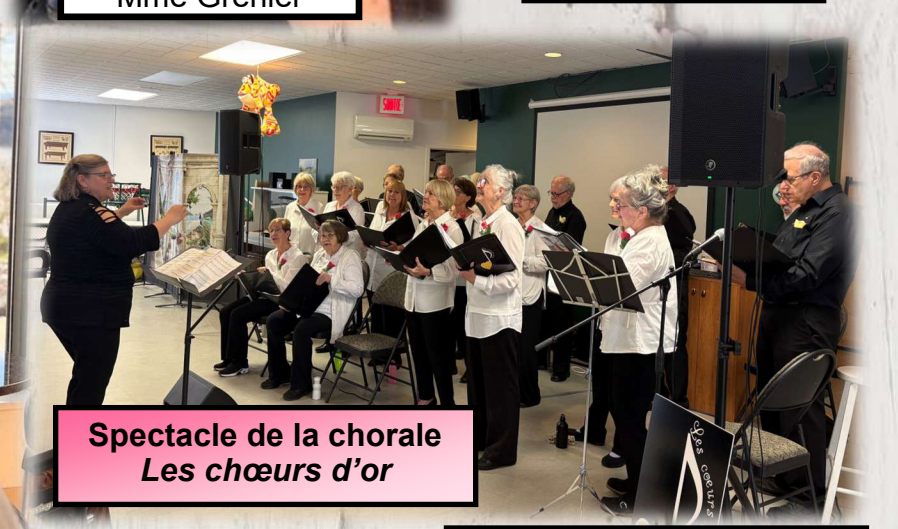
Spectacle de la chorale Les chœurs d'or